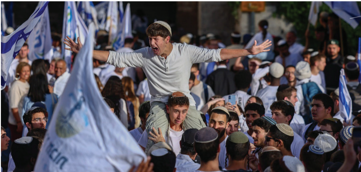
ריקוד דגלים.

הגרעונים המשימתיים משנים את פני השטח ומייצרים מציאות חדשה - מתמיכה בעורך ובפצועי צה"ל ועד למיזמי קליטה אסטרטגיים בגליל. המפעל החברתי מקבל משקל סוגלי ומחויבות שלטונית ארוכת טווח, הודות לביסוס התקציביים של השרה אורית שטרק ולעשייתו הפרלמנטרית המאומצת של חבר הכנסת משה סולומון